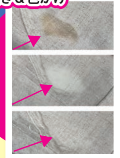
H・Hさん 染み抜き歴5年