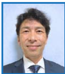
関西繊維商品めんてなんす研究会 株式会社太陽クリーニング 小野江CA担当理事